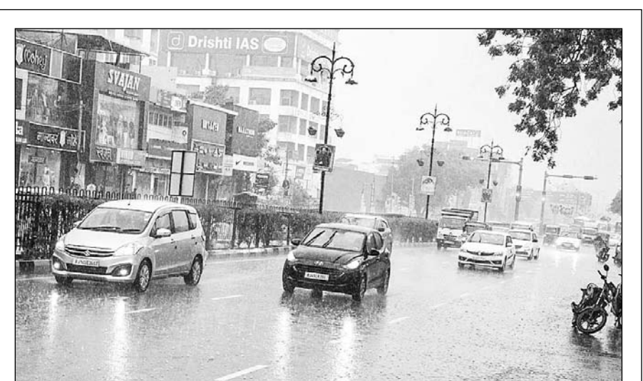
जयपुर में दोपहर बाद काली घटाएं घिर आईं और तेज बर्षा होने लगी। इस दौरान सड़कों पर पानी भर गया और वाहन चालकों को भारी परेशानी का सामना करना पड़ा। वहीं भारी टंड की वजह से लोग घरों में दुबकने को मजबूर हो गये।

रखते हैं उन्हें ऐसा नहीं करना चाहिए। संघ की विचारधारा किसी व्यक्ति विशेष या परिवार विशेष के लिए नहीं है। आरएसएस हमारी संस्कृति, हमारे नैतिक मूल्यों, हमारी सभ्यता और हमारे आदर्शों को महत्व देता है और इनके संवर्धन के लिए कार्य करता है। राहुल गांधी को देश को मजबूत बनाने वाली, भारत को आत्मनिर्भर बनाने वाली बातें करनी चाहिए थीं, लेकिन उनका भारत से संबंध करने का बयान देना, पूर्ण रूप से निंदनीय है।