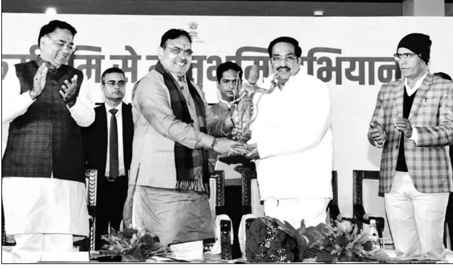
कर्मभूमि से मातृभूमि अभियान के अंतर्गत सांगानेर में मुख्यमंत्री भजनलाल शर्मा ने केन्द्रीय जलशक्ति मंत्री सी.आर. पाटिल का स्वागत किया।

जयपुर। केन्द्रीय जलशक्ति मंत्री सी. आर. पाटिल ने कहा है कि वह दिन दूर नहीं जब प्रधानमंत्री नरेन्द्र मोदी के नेतृत्व में राजस्थान सबसे अधिक पानी वाला राज्य होगा। उन्होंने कहा कि प्रधानमंत्री नरेन्द्र मोदी के नेतृत्व में केन्द्र सरकार और मुख्यमंत्री भजनलाल शर्मा के नेतृत्व में राज्य सरकार ने प्रदेश को जल आत्मनिर्भर बनाने के लिए महत्वपूर्ण प्रयास किए हैं। उन्होंने कहा कि आमजन भी जल की एक-एक बूंद के महत्व को समझते हुए जल संचय में जुड़े, इस उद्देश्य से शुरू किया गया कर्मभूमि से मातृभूमि अभियान अब एक जन आंदोलन का रूप लेता जा रहा है।