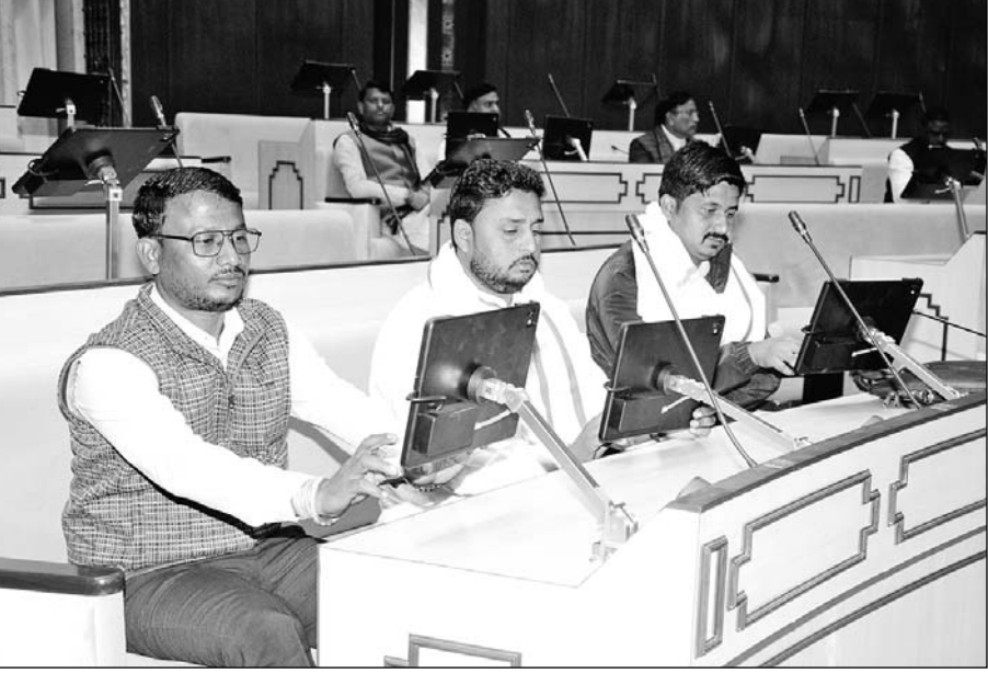
विधानसभा के सदन में आयोजित समारोह में लगभग एक सौ दस विधायकों ने बुधवार को आइपेड के माध्यम से एक दिवसीय प्रशिक्षण लिया।

■ 'तकनीकी युग की आवश्यकता अनुसार राजस्थान विधानसभा को बनाया जा रहा है पेपरलेस'