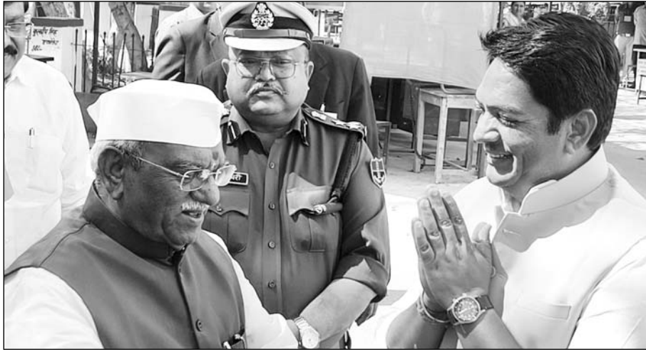
झुंझुनूं में कार्यक्रम के दौरान राज्यपाल राज्यपाल हरिभाऊ बागडे का मंत्री अविनाश गहलोत स्वागत किया।

इसलिए कांग्रेस को सिर्फ हंगामा करने से मतलब है। जबकि कहीं पर भी यह नहीं है कि किसी को दादी बोलाया अपमानजनक है।