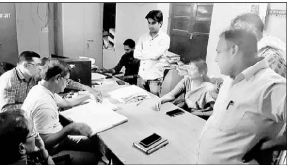
नगरपालिका कार्यालय में पूछताछ के दौरान चैम्बर में मौजूद रही पालिका अध्यक्ष।

मालपुरा, (निंसी)। मालपुरा नगरपालिका प्रशासन द्वारा अध्यक्ष व ईओ के हस्ताक्षरों से बीते दिनों ऑनलाइन लगाये 24 करोड़ से अधिक के टेण्डरों में धांधली व अनियमितताओं को लेकर पार्षदों द्वारा जिला कलेक्टर से की शिकायत के बाद कलेक्टर के आदेशों पर एडीएम द्वारा गठित जांच टीम ने मंगलवार को मालपुरा पालिका पहुंच शिकायतों से जुड़े दस्तावेजों की पड़ताल कर जेईएन व अन्य कार्यों में से पूछताछ की। इस दौरान पालिका अध्यक्ष का उसी कमी में मौजूद होना तथा अध्यक्ष के चैम्बर में उनके पति का उपस्थित रहना जांच को प्रभावित किये जाने का अंदेशा जताकर शिकायतकर्ता पार्षदों ने कड़ी नाराजगी जताई।