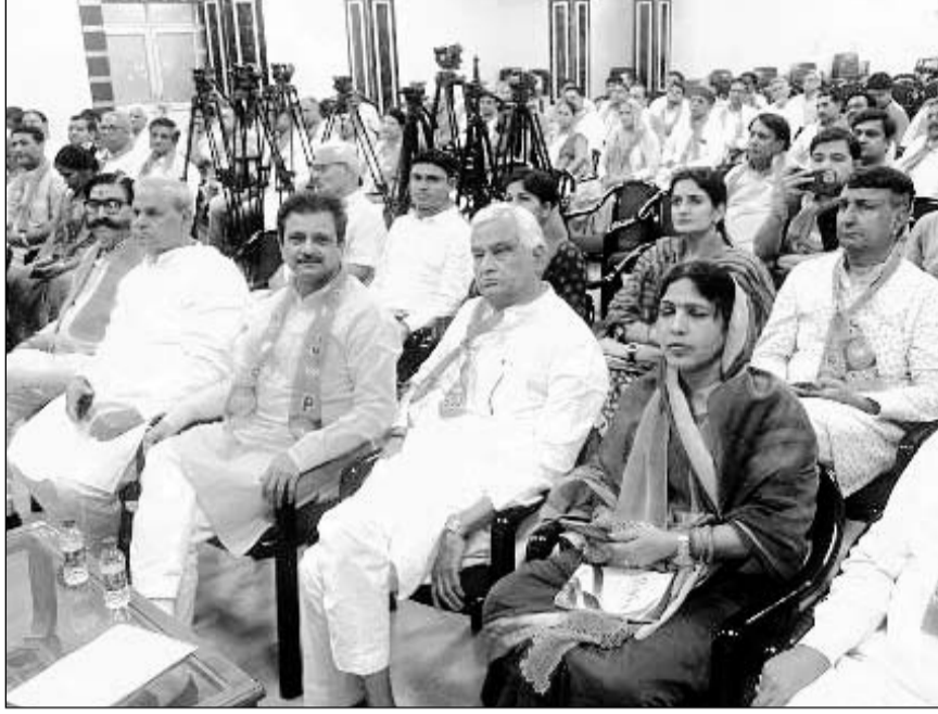
करौली धौलपुर सांसद डॉ. मनोज राजौरिया ने ईआरसीपी प्रोजेक्ट की बैठक में भाग लिया।

करौली, (निंसी)। करौली धौलपुर सांसद डॉ. मनोज राजौरिया ने मंगलवार को पूर्वी राजस्थान से संबंधित महत्वपूर्ण ईस्टर्न राजस्थान कैनल प्रोजेक्ट (ई.आर.सी.पी.) के संबंध में भाजपा प्रदेश कार्यालय में आयोजित बैठक में हिस्सा लिया। सांसद डॉ. राजौरिया ने बैठक में अपने संसदीय क्षेत्र करौली, धौलपुर की जल संबंधी मांगों को रखा तथा जो क्षेत्र ईस्टर्न राजस्थान कैनल प्रोजेक्ट में सम्मिलित नहीं किये गये हैं। उन्हें भी इसमें शामिल करने की मांग उठाया। सांसद डॉ. मनोज राजौरिया ने बताया कि इस बैठक में केन्द्रीय जलसंयोजक मंत्री एवं जोधपुर सांसद गजेन्द्र सिंह शेखावत ने अवगत कराया कि मुख्यमंत्री अशोक गहलोत प्रदेश की जनता को प्रमित कर रहे हैं। इन्होंने इस परियोजना को उलझाने के उद्देश्य से इसके उचित प्रस्ताव केन्द्र को नहीं भेजे हैं। देश में अभी तक किसी भी परियोजना को राष्ट्रीय परियोजना घोषित करने के लिए उसके लिए 75 प्रतिशत जल निरभरता के प्रस्ताव राज्य द्वारा केन्द्र को भेजे जाते हैं। इसके बाद ही राष्ट्रीय परियोजना घोषित किया जा