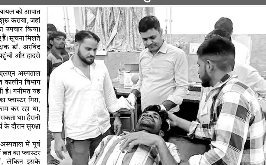
घायल मजदूर का इलाज करते चिकित्सक।

मालूम हो कि जेएलएन अस्पताल में पूर्व में भी कई वाडों सहित पोच में छत का प्लास्टर गिरने से हादसे हो चुके हैं, लेकिन इसके बावजूद भी अस्पताल प्रशासन ने अभी तक कोई सुध नहीं ली है।