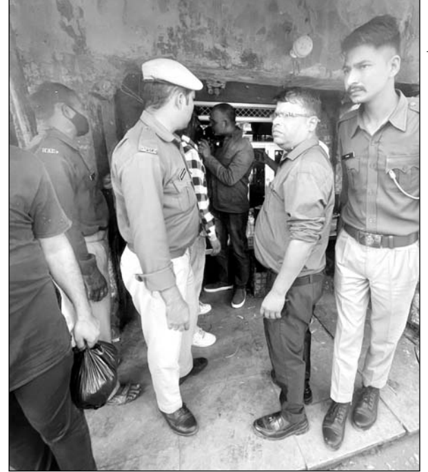
नगर निगम हैरिटेज की पशु प्रबंधन शाखा ने बुधवार को परकोटा क्षेत्र में संचालित मांस की अवैध दुकानों पर कार्रवाई की।