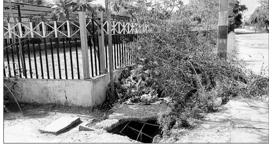
मालपुरा कोर्ट परिसर में कचरा डिपो बने पार्क में घटिया निर्माण से नाले क्षतिग्रस्त हो रहे हैं।

वर्ष 2019 में शहर के सौन्दर्यकरण का बोड़ा उठाये तत्कालीन पालिका अध्यक्ष व प्रशासन द्वारा मालपुरा कोर्ट परिसर में लाखों रुपयों की लागत से पार्क निर्माण करवा कर बाहर से मंगवाकर घास व पौधे लगाये गये थे लेकिन स्थानीय पालिका प्रशासन की उदासीनता व देखरेख के अभाव में महज दो साल में ही यह पार्क कचरा डिपो में तब्दील हो गया। घास व पौधे सूख जाने से हरिशाली उमड़ गई। इतना ही नहीं नवीन न्यायालय भवन से जयपुर सड़क मार्ग तक बरसाती पानी