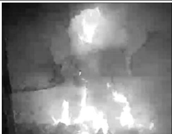
सज्जन एजेंसी के चप्पल गोदाम में भीषण आग से माल जल गया।