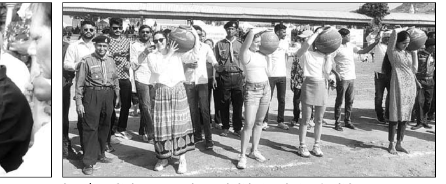
मेला मैदान में खेलकूद प्रतियोगिताओं में देशी-विदेशी पर्यटकों ने दमखम दिखाया।