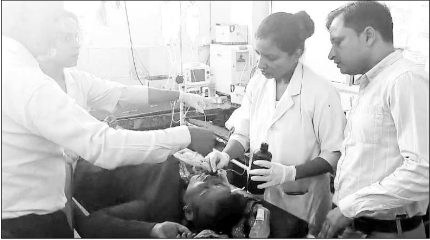
घायल महिलाओं को उपचार के लिए अस्पताल में भर्ती कराया।