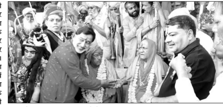
पुष्कर के सप्तऋषि घाट पर संतों ने शाही स्नान किया।

अजमेर/पुष्कर, (कासं)। तीर्थ नगरी पुष्कर में चले रहे अंतर्राष्ट्रीय पुष्कर मेले में गुरुवार को ब्रह्म चौदस पर देश भर से आए साधु संतों ने सरोवर के सप्त ऋषि घाट पर शाही स्नान कर सम्पूर्ण मानव जाति के कल्याण और देश में खुशहाली की मनोकामना की। कार्तिक पूर्णिमा के पदम् योग के संयोग में शुक्रवार को पुष्कर सरोवर में महास्नान के साथ धार्मिक मेले का सामपन होगा। पूर्णिमा महास्नान के लिए श्रद्धालुओं का रेला गुरुवार की दोपहर बाद से उमड़ने लग गया। देर शाम तक लाखों श्रद्धालु पुष्कर पहुंच गए और उनके आने का सिलसिला जारी है। शुक्रवार अलसुबह ब्रह्म मुहूर्त में पूर्णिमा पर सरोवर में महास्नान होगा जो पूरे दिन भर चलेगा।