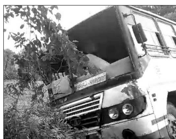
तीजवड मोड़ के पास सड़क किनारे से नीचे उतरी रोडवेज बस।

घटना के बाद डूंगरपुर से रोडवेजकर्मियों, पुलिस मौके पर पहुंचे और घायलों को बस से बाहर