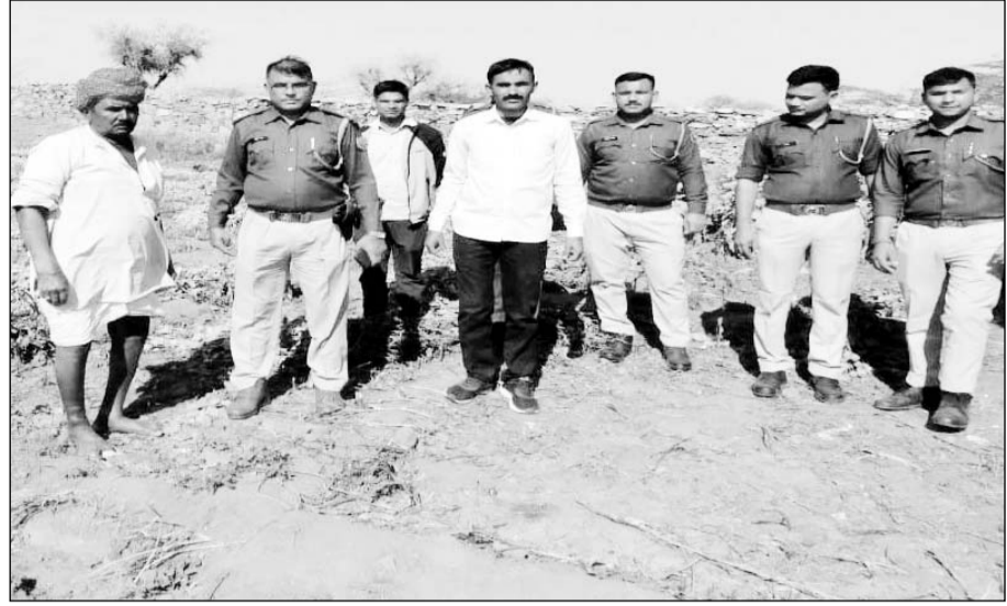
भीलवाड़ा में कोरेड़ा पुलिस ने कार्रवाई करते हुए गाजा व अफीम की खेती पकड़ी।

भीलवाड़ा, (निस)। जिले भर में मादक पदार्थ के खिलाफ चलाए जा रहे हैं अभियान के तहत कोरेड़ा पुलिस ने बड़ी कार्रवाई करते हुए गाजा व गाजे की खेती व अफीम की खेती पकड़ी जिसकी बाजार कीमत लाखों में बताई जा रही है।