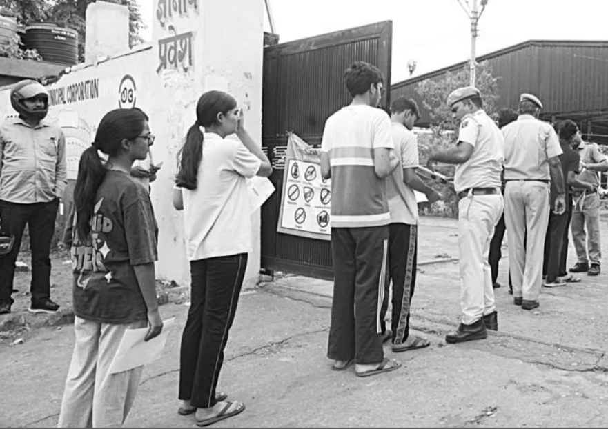
नीट परीक्षा देने पहुंचे अभ्यर्थियों को परीक्षा केंद्र में प्रवेश देने से पूर्व पुलिस ने उनकी गहनता से जांच की।

-कार्यालय संवाददाता- जयपुर। राष्ट्रीय पात्रता सह प्रवेश परीक्षा (नीट-यूजी) की पुनः परीक्षा रविवार को राजधानी जयपुर में कड़े सुरक्षा प्रबंधों और प्रशासनिक निगरानी के बीच शांतिपूर्ण एवं सुव्यवस्थित ढंग से संपन्न हुई। जयपुर जिले के 103 परीक्षा केंद्रों पर आयोजित परीक्षा में 37128 अभ्यर्थी पंजीकृत थे। जिनमें से 34031 अभ्यर्थी उपस्थित रहे, जबकि 3,097 अनुपस्थित रहे। इस प्रकार कुल उपस्थित 91,66 प्रतिशत दर्ज की गई। परीक्षा दोपहर 2 बजे शुरू होकर शाम 5:15 बजे समाप्त हुई। नेशनल टेस्टिंग एजेंसी (एनटीई) ने अभ्यर्थियों को 15 मिनट का अतिरिक्त समय दिया। परीक्षा समाप्त होने के बाद 22 गोदाम सिकिल, परकोटा क्षेत्र के प्रमुख बाजारों तथा शहर के कई व्यस्त मार्गों पर परीक्षाार्थियों और उनके परिजनों की भीड़ उमड़ने से यातायात व्यवस्था प्रभावित नहीं और कई स्थानों पर वाहन रंगते नजर आए। परीक्षा की संवेदनशीलता को देखते हुए इस बार अभूतपूर्व सुरक्षा व्यवस्था की गई थी। अभ्यर्थियों को परीक्षा केंद्र में प्रवेश से पहले श्री-लेयर सिक्वोरिटी जांच से