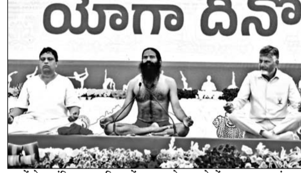
चुटनों से सर्वभक्ति चालन क्रियाओं का अभ्यास कराया गया, तत्पश्चात खड़े होकर करने वाले आसनों में ताडासन, वृक्षासन, पादहस्तासन, अर्ध चक्रासन और त्रिकोणासन, बैठकर करने वाले आसनों में भद्रासन, वज्रासन, अर्ध उष्ट्रासन, शशाकासन और उत्तान मंडूकासन, पेट के बल लेटकर करने वाले आसनों में मकरासन, भुजंगासन और शलभासन, पीठ के बल करने वाले आसनों में सेतुबंधासन, उत्तानपादासन, अर्ध हलासन और पवनसमुत्तान का अभ्यास कराया। अंत में प्राणायाम और ध्यान के लिए अनुलोम-विलोम, भ्रामरी, और ध्यान व संकल्प का अभ्यास कराया गया।

विजयवाड़ा। योगरूढ़ि स्वामी रामदेव ने आंध्रप्रदेश के अमरावती (विजयवाड़ा) में कृष्णा नदी क्षेत्र से योगमय राष्ट्र व योगमय विश्व का आव्हान किया। यह कार्यक्रम पतंजलि योगपीठ तथा आंध्र प्रदेश सरकार के संयुक्त तत्वाधान में हुआ था। जिसमें आचार्य बालकृष्ण महाराज भी उपस्थित रहे। इस वर्ष योग दिवस की थीम "स्वस्थ आयु के लिए योग" रही। वृत्तों का कार्यक्रम प्रातः 5 बजे से प्रारंभ हो गया था, किंतु सरकारी कार्यक्रम के योग प्रोटोकॉल अनुसार स्वामी रामदेव महाराज, आंध्र प्रदेश के मुख्यमंत्री एन. चंद्रबाबू नायडू एवं आचार्य बालकृष्ण महाराज ने 45 मिनट की मानकीकृत योग दिनचर्या का अनुपालन करते हुए लगभग हजारों योग साधकों को योग का अभ्यास कराया। प्रारंभ में प्रार्थना, ग्रीवा, कंधा, कमर और