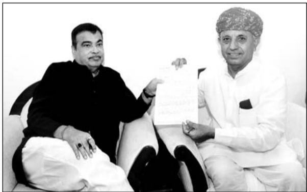
अजमेर सांसद भागीरथ चौधरी ने केंद्रीय सड़क एवं परिवहन मंत्री नितिन गडकरी से मिलकर लिखित पत्र सौंपा।

चौधरी ने सिलोरा, श्रीनगर, दिलवाड़ा, बान्दनवाड़ा एवं संजयनगर, बरल द्वितीय में निर्माणाधीन हाईवे पर प्रायवासियों की मांग पर जनहित में नवीन ओवरब्रिज एवं आरीवाल पुलिया निर्माण, फ्लाईओवर की आवश्यकता से केंद्रीय मंत्री को अवगत कराया, और इसी वित्तीय वर्ष में उनकी स्वीकृति हेतु आटाह किया।