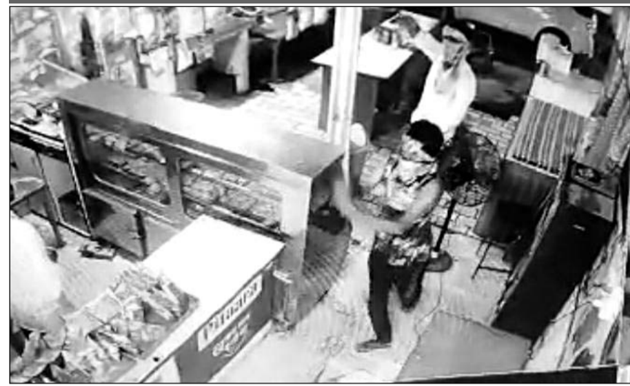
होटल में तोड़-फोड़ करते कार सवार युवक।

बीदासर, (निर्स)। निकटवर्ती ग्राम साण्डवा में सोमवार की रात्रि में बिना नम्बरी कार में सवार दबंगों ने एक होटल में तोड़-फोड़ की और होटल मालिक को डराया-धमकाया जिसका मुकदमा होटल मालिक ने मंगलवार की शाम पुलिस थाना साण्डवा में दर्ज करवाया है।