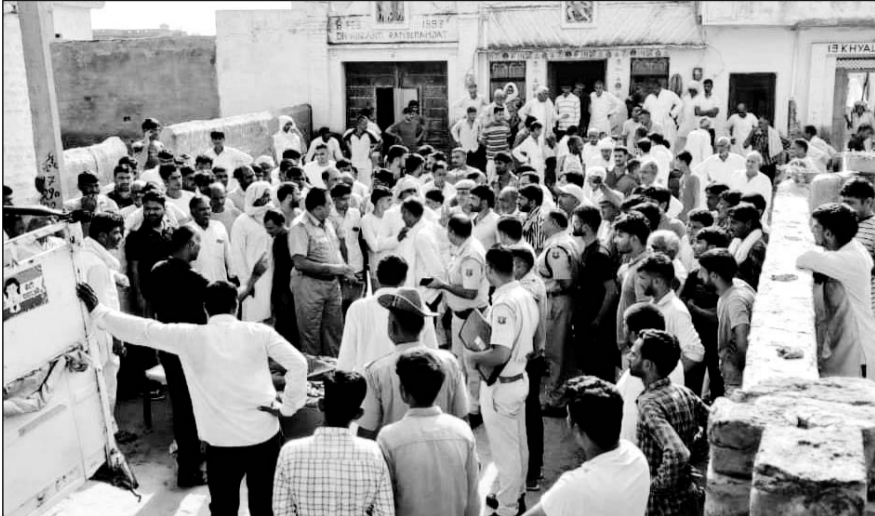
मोर्चरी के बाहर पोस्टमार्टम कार्यवाही के दौरान मौके पर लोगों की भीड़ जमा हो गई।