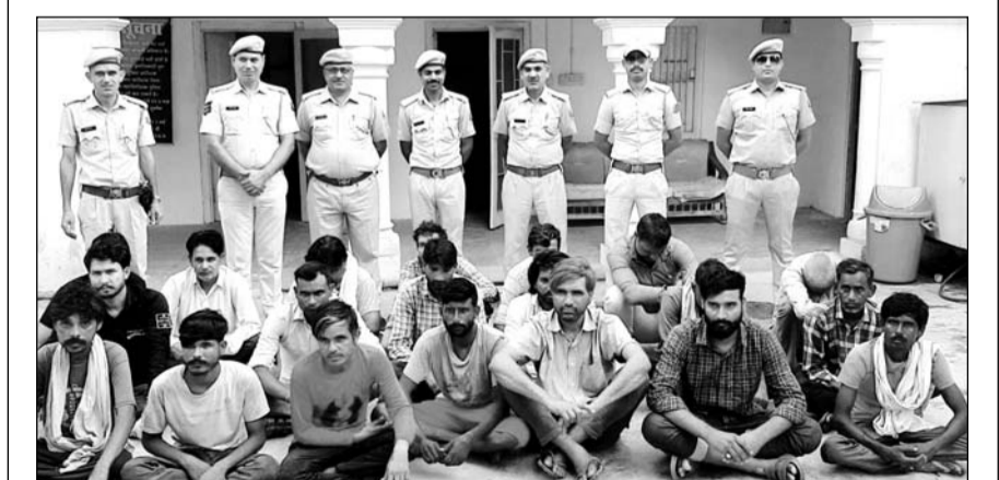
कोटपतली पुलिस की गिरफ्त में आरोपी।