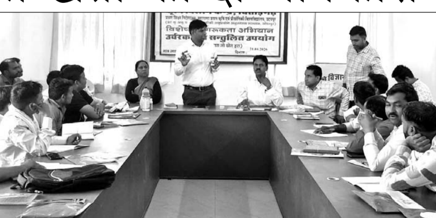
किसानों को दी तकनीकी खेती की जानकारी दी।

उदयपुर, (कासं)। कृषि विज्ञान केंद्र द्वारा विशेष जागरूकता अभियान, उर्वरकों का संतुलित उपयोग, उर्वरकों का संतुलित उपयोग और प्रोफेशनल क्रिकेट जैसा अनुभव प्रदान किया। विजेता टीम, उदयपुर इंग्लस और उनके नामित न्युवोको अधिकृत डीलर को कुल 11 लाख रुपये के पुरस्कार से सम्मानित किया गया। यह सम्मान पूरे टूर्नामेंट के दौरान उनके शानदार प्रदर्शन और टीम भावना की पहचान के रूप में दिया गया।