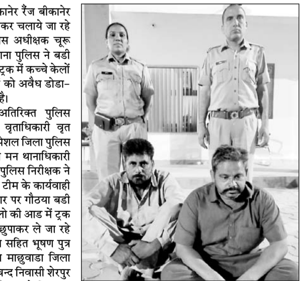
तस्करी के आरोपियों को पुलिस ने गिरफ्तार किया।