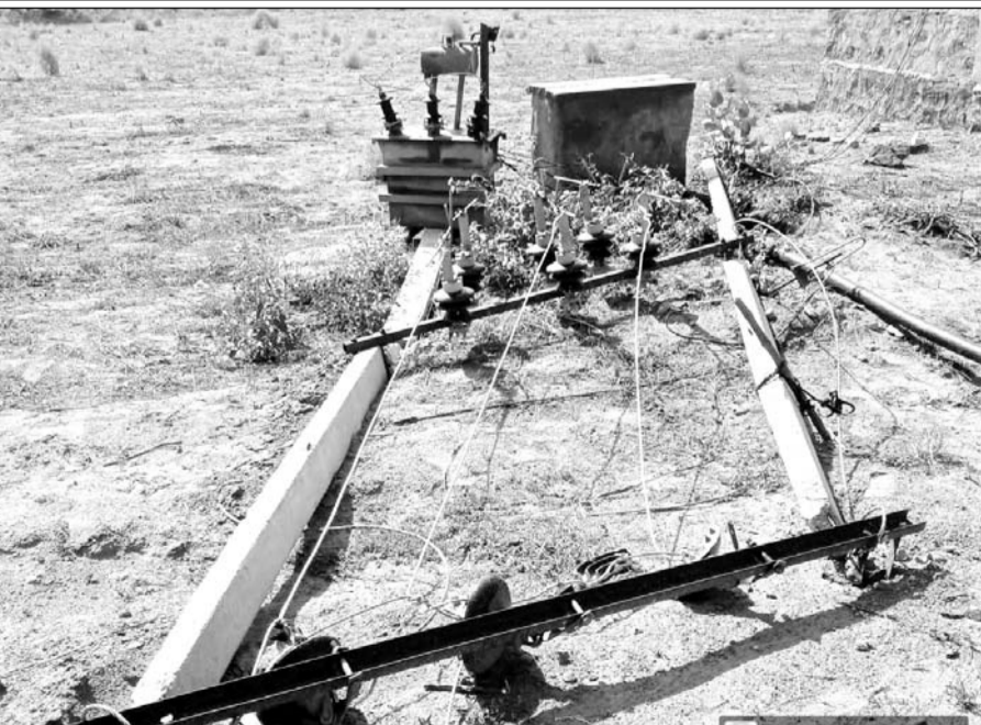
तूफान के दौरान टूटकर गिरा विद्युत पोल।

बीदासर, (निर्स)। क्षेत्र में बुधवार की रात्रि में नौ बजे के बाद आये तेज तूफान से आम जन-जीवन अस्त-व्यस्त हो गया। तूफान के दौरान अत्यधिक तीव्र गति से हवाएं चली और बिजलियां गिरी। लगभग दो घण्टे तक चली तेज हवाओं और आंधी से चारों ओर धूल का गुबार छा गया। इस दौरान अनेक स्थानों पर विद्युत पोल, ट्रांसफार्मर, पेड़ उखड़ गये।