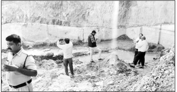
खनिज अभियंता चित्तौड़गढ़ के क्षेत्राधिकार में टीम ने कार्रवाई की।

उदयपुर, (कासं)। अतिरिक्त निदेशक माईस उदयपुर जोन दीपक तंवर के निर्देशन में खान विभाग की टीम ने चित्तौड़गढ़ के भूपालसागर के पारी गांव में अवैध खनन के खिलाफ बड़ी कार्रवाई की। टीम द्वारा खनिज क्वार्टर का मौके पर 16-16 टन वजन के दो ब्लॉक और एक्सकवेटेड माल पकड़ा गया। इसके साथ ही किए गए खनन का अंकलन करने पर 2592 टन अवैध खनन पाया गया। खनिज क्वार्टर की कोमत लगभग 50 हजार प्रति टन बताई जा रही है। इस तरह से करीब 6 करोड़ रुपये से अधिक के क्वार्टर खनिज का अवैध खनन पाया गया है। अतिरिक्त निदेशक तंवर ने खनिज अभियंता चित्तौड़गढ़ को संबंधित के खिलाफ मामला दर्ज कराने के निर्देश दिए हैं। अतिरिक्त निदेशक दीपक तंवर को