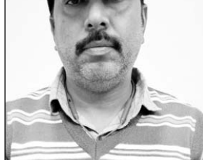
घूस लेने का आरोपी पटवारी।