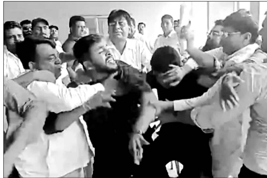
अजमेर में कांग्रेसियों के बीच विवाद हो गया।