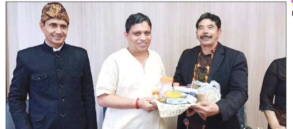
पतंजलि योगपीठ और इंडोनेशिया के यूनिवर्सिटी हिंदू नेगरी के बीच एमओयू पर हस्ताक्षर किए।

हरिद्वार। पतंजलि योगपीठ और इंडोनेशिया के एकमात्र हिंदू विश्वविद्यालय, यूनिवर्सिटी हिंदू नेगरी के बीच इंडोनेशिया में एक समझौता ज्ञापन (एमओयू) पर हस्ताक्षर किए गए हैं। यह साझेदारी न केवल दोनों देशों के बीच शैक्षणिक और अनुसंधान के सेतु का निर्माण करेगी, बल्कि बाली की धरत पर सनातन और योग के वैभव को पुनर्जीवित करने में मौलिक पाथर साबित होगी। पतंजलि विश्वविद्यालय के कुलपति