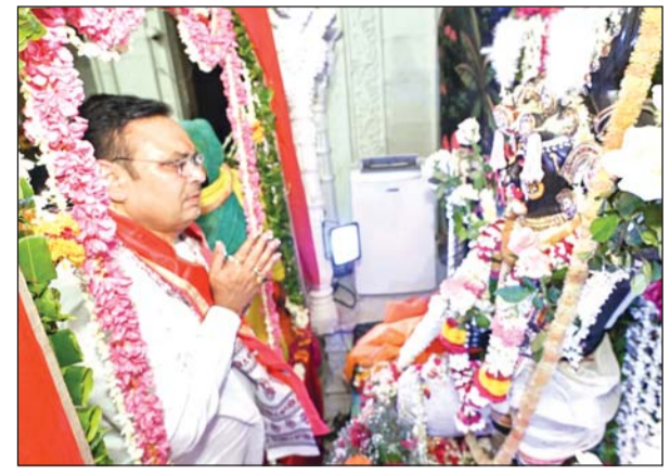
मुख्यमंत्री भजनलाल शर्मा ने सोमवार को गोवर्धन क्षेत्र के पूंछरी स्थित श्रीनाथजी मंदिर में सपत्नीक पूजा-अर्चना कर प्रदेश की सुख-समृद्धि और खुशहाली की कामना की।

जयपुर। मुख्यमंत्री भजनलाल शर्मा ने सोमवार को गोवर्धन क्षेत्र के पूंछरी स्थित श्रीनाथजी मंदिर में सपत्नीक पूजा-अर्चना कर प्रदेश की सुख-समृद्धि और खुशहाली की कामना की। मंदिर पहुंचने पर श्रद्धालुओं और स्थानीय लोगों ने मुख्यमंत्री का उत्साहपूर्वक स्वागत एवं अभिनंदन किया।