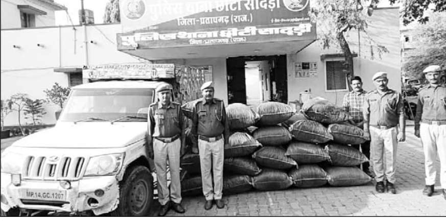
छोटी सादड़ी थाना पुलिस की टीम ने 325 किलो डोडा-चूरा जब्त किया।