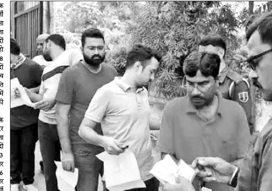
परीक्षा केंद्र पर जांच के बाद परीक्षा देने जाते अभ्यर्थी।