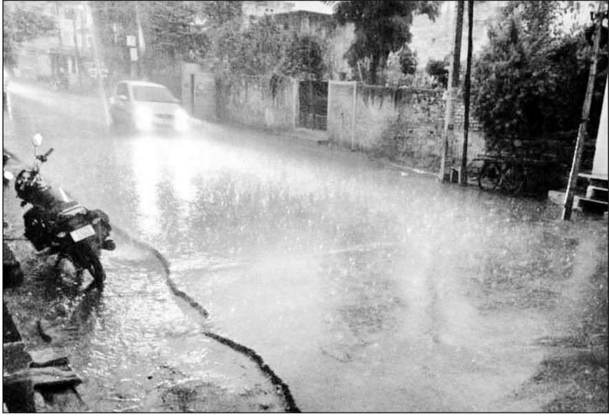
उदयपुर शहर में मूसलाधार बारिश के दौरान बाजार सुनसान नजर आए।

उदयपुर पहुंचा मानसून, करीब एक घंटे जमकर बरसे बदरा