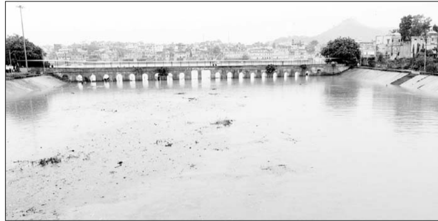
पुष्कर के पवित्र सरोवर में पानी की आवक शुरू हुई।

पुष्कर, (निसं)। पुष्कर में शुक्रवार सुबह से दोपहर तक हुई मूसलाधार बरसात हुई जिससे पवित्र सरोवर में पानी की आवक शुरू हो गई है। वही निचली बस्तियों में पानी भर जाने से लोगों को काफी दिक्कतों का सामना करना पड़ रहा है। सुबह 9:30 बजे से रुक-रुककर बरसात हो रही है। एक घंटे तक जमकर मूसलाधार बरसात हो जाने से पवित्र सरोवर में नाग पहाड़ की पहाड़ियों से फीडरों के द्वारा पानी की आवक शुरू हो गई है तो वहीं बराह घाट चोक गुरुद्वारा माली, मोहल्ला, परिक्रमा मार्ग, सावित्री मार्ग और पुराने रंगजी के मंदिर के बाहर पानी भर जाने से क्षेत्र के लोगों को काफी दिक्कतों का सामना करना पड़ रहा है।