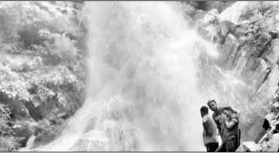
टोंक क्षेत्र में मानसून की पहली बरसात के बाद झरने चले।

टोंक, (निसं)। जिले के टोडारायसिंह क्षेत्र में मानसून की पहली बरसात ने उपखण्ड क्षेत्र के खेतों को तरबतर कर दिया, वहीं बारिश से पहाड़ों में झरने फूट पड़े, जिसका लुप्त उठाने के लिए कस्बे से सैकड़ों लोग का जमावड़ा सुबह से ही लगाने लगा।