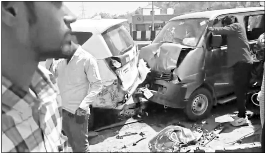
हादसे के बाद मौके पर पहुंचे लोगों ने घायलों को गाड़ियों से निकाला।

बताया जा रहा है कि हादसे में कई लोग घायल हुए हैं, बाइक सवार युवक भी गंभीर घायल, नौ लोग हॉस्पिटल में भर्ती