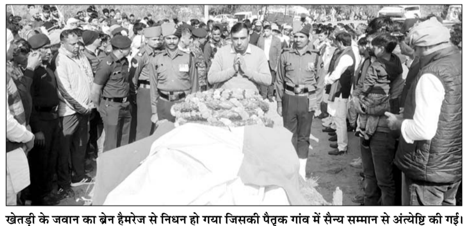
खेतड़ी के जवान का ब्रेन हैमरेज से निधन हो गया जिसकी पैतृक गांव में सैन्य सम्मान से अंत्येष्टि की गई।

खेतड़ी, (निर्स)। खेतड़ी उपखंड के राजोता पंचायत की ढाणी लगरियावाली निवासी सेना के जवान का ब्रेन हैमरेज होने से निधन हो गया।