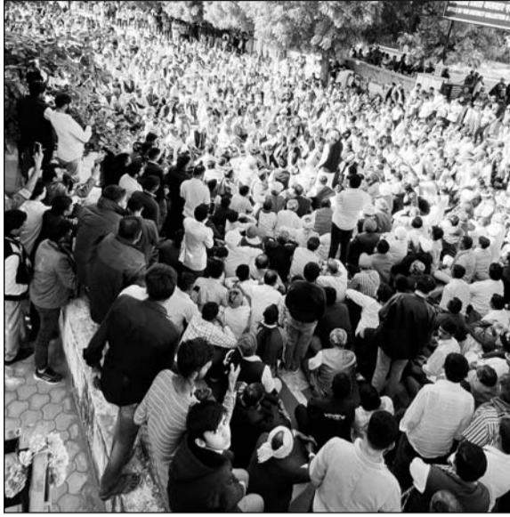
सांचौर जिला निरस्त होने के विरोध में उमड़ा जनाक्रोश।