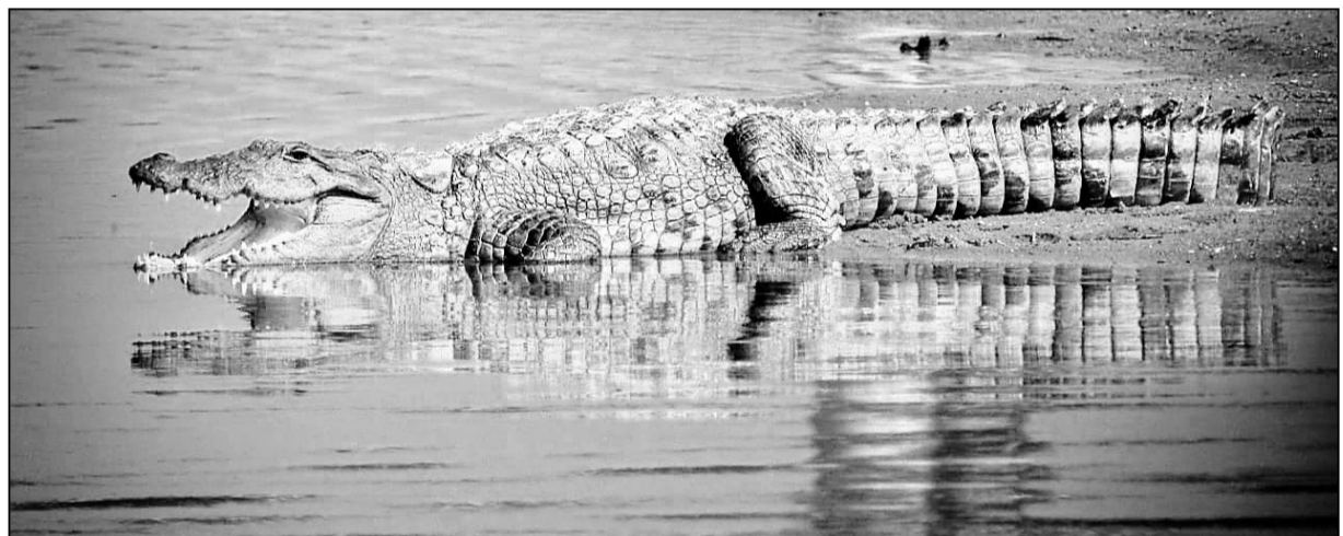
सर्दी बढ़ने के साथ चंबल किनारे अठखेलियां कर रहे घड़ियाल और मगरमच्छ।