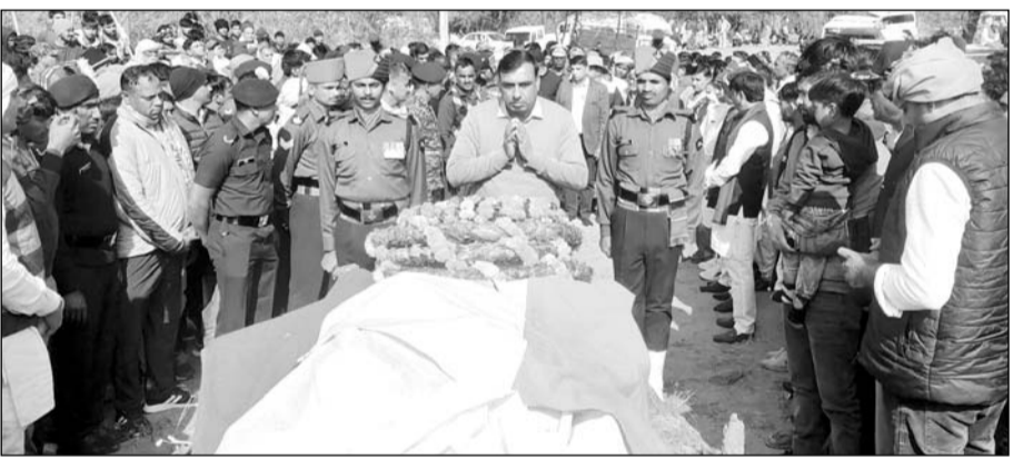
खेतड़ी के जवान का ब्रेन हैमरेज से निधन हो गया जिसकी पैतृक गांव में सैन्य सम्मान से अंत्येष्टि की गई।

खेतड़ी, (निसं)। खेतड़ी उपखंड के राजोता पंचायत की ढाणी लगरियावाली निवासी सेना के जवान का ब्रेन हैमरेज होने से निधन हो गया।