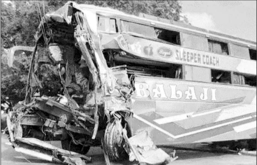
हादसे में बस का अगला हिस्सा पूरी तरह क्षतिग्रस्त हो गया।