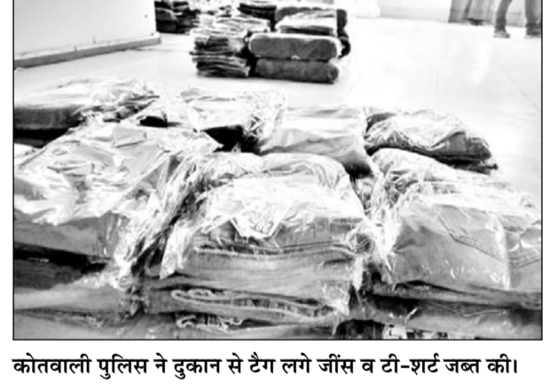
कोतवाली पुलिस ने दुकान से टैग लगे जींस व टी-शर्ट जब्त की।