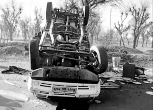
अनियंत्रित होकर पलटी पिकअप।

चौमू / कालाडोरा, (निर्स)। शनिवार को एक पिकअप गाड़ी रेनवाल थाना क्षेत्र के बथाल-इटावा रोड पर अनियंत्रित होकर पलट गई। इस हादसे में पिकअप गाड़ी में बैठे 10 लोग घायल हो गए। सूचना मिलने पर रेनवाल थाना पुलिस मौके पर पहुंची और घायलों को 108 एम्बुलेंस की सहायता से कालाडोरा सामुदायिक स्वास्थ्य केन्द्र पर भिजवाया गया। जहां पर घायल हुए लोगों का सामुदायिक स्वास्थ्य केन्द्र के डॉक्टरों ने इलाज प्रारंभ किया व दो घायलों की हालत गंभीर होने पर जयपुर रेफर किया गया। रेनवाल थाना पुलिस ने क्रेन की मदद से पिकअप को बीच रोड से साइड करवा कर ट्रैफिक को चालू करवाया। जानकारी के अनुसार पिकअप गाड़ी में 10 लोग इटावा से कैटरिंग का