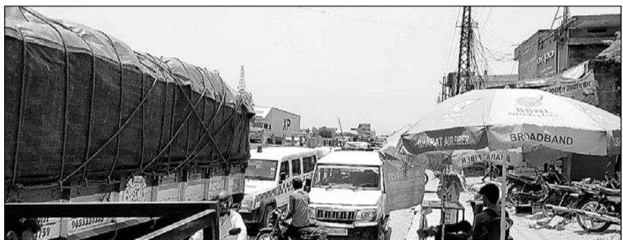
पावटा में जाम के दौरान फंसी एम्बुलेंस।

पावटा, (निस)। सप्ताह के पहले दिन सोमवार को पावटा कस्बे के सर्विस रोड पर जाम लगा गया और वाहनों की लंबी कतारें लग गईं। वहीं यातायात व्यवस्था को सुगम बनाने के लिए प्रगपुर स्थाना व यातायात पुलिसकर्मियों द्वारा कोई कोशिश नहीं आई।