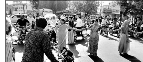
पेयजल संकट को लेकर महिलाओं ने जाम लगा प्रदर्शन किया।

भीलवाड़ा, (निस)। भीषण गर्मी के बीच भीलवाड़ा में पेयजल का संकट गहराने लगा है। जलदाय विभाग की लापरवाही के खिलाफ महिलाओं का गुस्सा फूटा और आक्रोशित महिलाओं ने सड़क मार्ग पर जाम लगा प्रदर्शन शुरू किया।