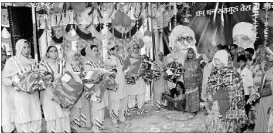
भण्डारे में उपस्थित साधु-संगत कम्बल वितरित करते सेवादार।

वहीं आयोजित भण्डारे में उपस्थित चूरू जॉन की साध संगत ने एकजुटता का परिचय देते हुए हाथ उठाकर पूज्य गुरु संत डॉ. गुरमीत राम रहीम सिंह जी इन्सां पर दृढ़ विश्वास व्यक्त किया। वहीं साध संगत ने सिद्धमुख के खेल ग्राउंड में लगी बड़ी स्क्रीन के माध्यम से पूज्य गुरु जी के रिकॉर्डिंग पावन वचनों को एकाग्रचित होकर श्रवण किया। इसके