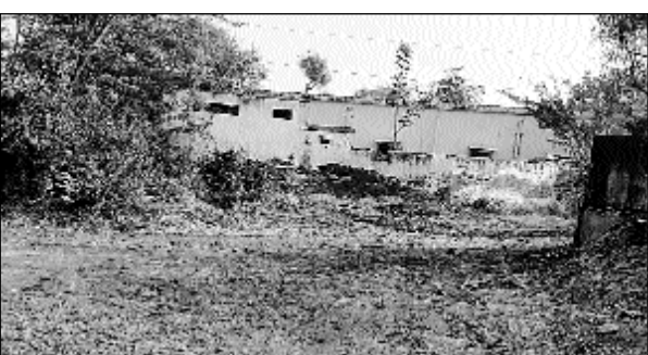
खन माफियाओं द्वारा अवैध रूप से निकाला गया रास्ता।

पाटन, (निर्स)। कस्बे के नजदीक गांव मीणा की नंगल के माईनिंग जेठ व वाहनों के आवागमन के लिए प्रशासन की सांठ-गांठ से खन माफियाओं द्वारा अवैध रूप से रास्ता निकालने की तैयारी हो रही है। इसके ले कर ग्रामीणों द्वारा आंदोलन की चेतावनी दी गई है।