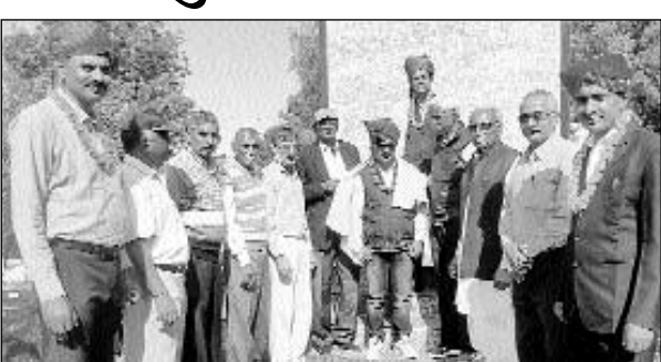
वीरवर झुझारसिंह पार्क में जिला पुरस्कृत शिक्षक फोरम का प्रतिभा सम्मान समारोह का आयोजन हुआ।

झुंझुनू, (निर्स)। वीरवर झुझारसिंह पार्क में जिला पुरस्कृत शिक्षक फोरम का प्रतिभा सम्मान समारोह का आयोजन हुआ। इस अवसर पर वर्तमान समय की शैक्षिक समस्याओं पर चिंतन व विचार विमर्श हुआ। ऑनलाइन शिक्षण से बालकों में हो