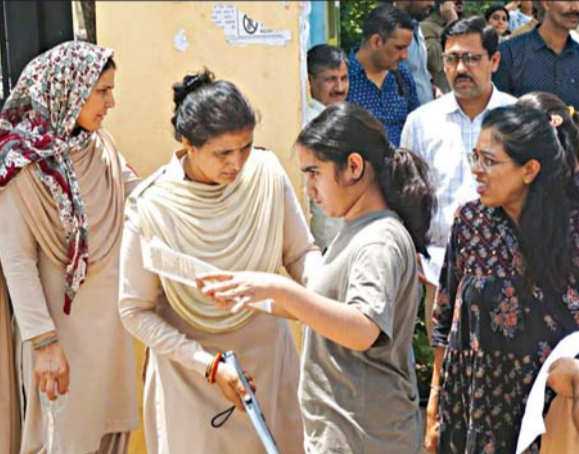
जयपुर के परीक्षा केन्द्रों पर नीट परीक्षा देने पहुंचे अभ्यर्थियों को गहन जांच के बाद ही प्रवेश दिया गया।