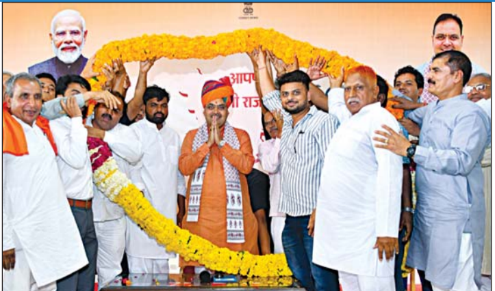
मुख्यमंत्री भजनलाल शर्मा का उनके निवास पर ओड समाज के लोगों ने स्वागत किया।

कार्यक्रम के दौरान मुख्यमंत्री ने पाक विस्थापित ओड समाज के लोगों की हरसंभव सहायता का आश्वासन देते हुए कहा कि राज्य सरकार उनके सामाजिक और शैक्षिक विकास के लिए प्रतिबद्ध है। मुख्यमंत्री ने प्रदेश सरकार द्वारा पेयजल और सिंचाई परियोजनाओं पर किए जा रहे कार्यों का उल्लेख करते हुए कहा कि किसानों को दिन में बिजली उपलब्ध कराई जा रही है तथा ग्रामीण और श्रमिक वर्ग के जीवन स्तर को बेहतर बनाने के लिए अनेक योजनाएँ संचालित की जा रही हैं। उन्होंने प्रधानमंत्री नरेन्द्र मोदी की अग्रणी भूमिका के लिए आभार व्यक्त किए हुए कहा कि महिलाओं, किसानों, श्रमिकों और वंचित वर्गों के सशक्तिकरण के लिए केंद्र और राज्य सरकार मिलकर कार्य कर रही हैं।