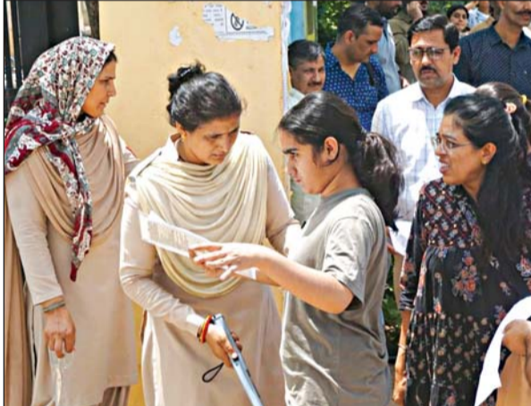
जयपुर के परीक्षा केन्द्रों पर नीट परीक्षा देने पहुंचे अभ्यर्थियों को गहन जांच के बाद ही प्रवेश दिया गया।

राजधानी में कुल 36508 ने भाग लिया, 851 परीक्षार्थी अनुपस्थित