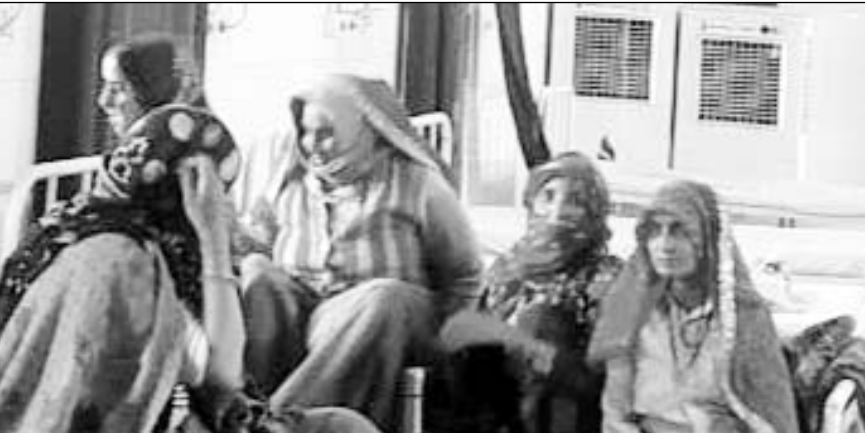
अस्पताल के वार्ड में झड़ते प्लास्टर के नीचे प्रसुताएं बैठी हैं।

अस्पताल प्रबंधन जर्जर जच्चा वार्ड की मरम्मत कराना उचित नहीं समझते हैं। जबकि प्रत्येक माह इस अस्पताल में 50 से 100 महिलाएं