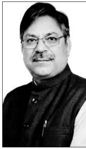
डॉ. सतीश पूनिया।

जयपुर। भाजपा हरियाणा प्रभारी एवं राजस्थान भाजपा पूर्व प्रदेश अध्यक्ष डॉ. सतीश पूनिया ने राजस्थान, महाराष्ट्र सहित तमाम राज्यों के विधानसभा चुनाव और उपचुनाव में भाजपा की ऐतिहासिक जीत पर कहा कि महाराष्ट्र विधानसभा चुनाव और राजस्थान समेत विभिन्न राज्यों के विधानसभा उपचुनावों में भाजपा की शानदार जीत यह दर्शाती है कि जनता ने भाजपा की नीतियों और प्रधानमंत्री नरेंद्र मोदी के कुशल नेतृत्व में चल रही डबल इंजन सरकारों पर अपना पूरा भरोसा जताया है। जनता ने कांग्रेस और उसके गठबंधन को उनकी धराशायी हो चुकी जमीन की स्थिति का आईना दिखा दिया है। भाजपा की इस सफलता ने यह साबित कर दिया है कि जनता को विकास, सुशासन और स्थिरता पर भरोसा है, जबकि कांग्रेस और उसके सहयोगी दलों की राजनीति को जनता ने नकार दिया है।