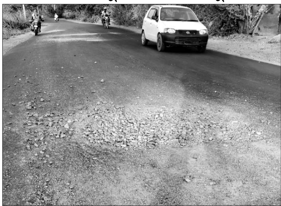
भीण्डर से गुजर रहे स्टेट हाइवे पर जगह-जगह क्रैकीट बिखरी हुई है व बड़े-बड़े खड्डे बने हुए हैं।

भीण्डर, (निंसी)। कीर की चौकी-सलुम्बर स्टेट हाइवे का उपयोग करने पर टोल वसूलने में कोई कमी नहीं की जा रही है, लेकिन इस हाइवे की दूरदशा पर विभाग कोई ध्यान नहीं दे रहा है। स्टेट हाइवे पर बड़े-बड़े खड्डे होने के बावजूद उनको दूरस्त करने का काम नहीं किया जा रहा है। वहीं कुछ स्थानों पर खड्डों में केवल ग्रेवल डाल देने से पूरी सड़क पर क्रैकीट बिखर रही है।