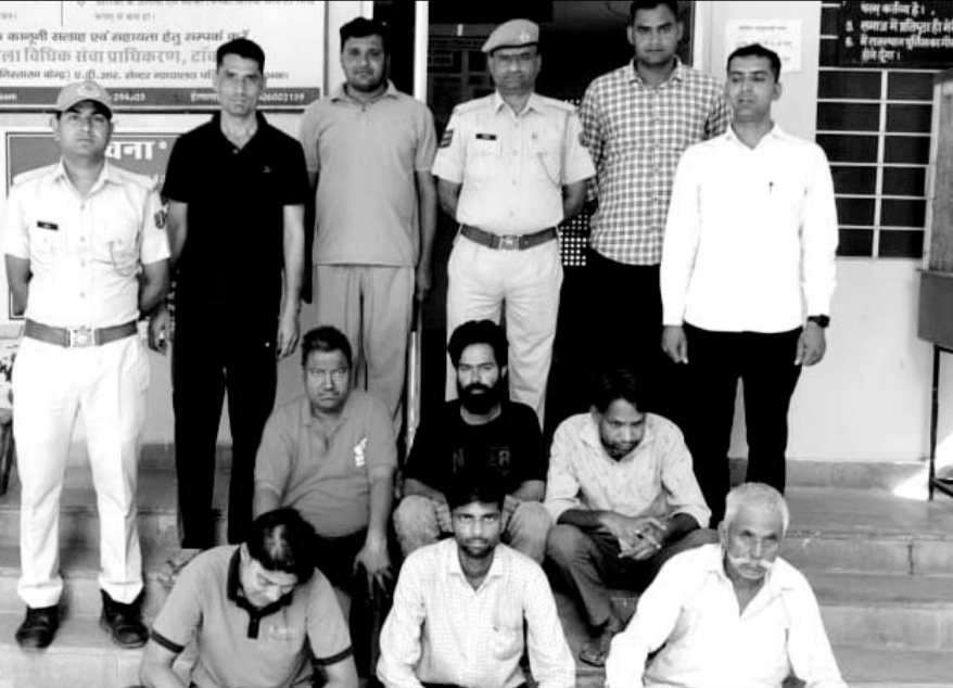
तीन स्थाई वारंटी व 4 गिरफ्तारी वारंटियों को अलग-अलग जगह से गिरफ्तार किया।