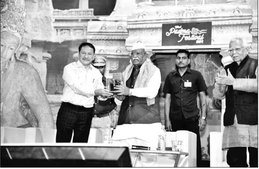
राज्यपाल हरिभाऊ बागडे ने तृतीय पद्म फेस्टिवल का उद्घाटन किया।

जयपुर। राज्यपाल हरिभाऊ बागडे ने कहा है कि मानव जीवन महत्वपूर्ण नहीं होता है, महत्वपूर्ण यह होता है कि मनुष्य उसे किस प्रकार आदर्श रूप में जीता है। उन्होंने कहा कि सफलता उन्हें ही मिलती है जो निरंतर मेहनत करते हैं। देश की संस्कृति और उपलब्धियों के गौरवशाली इतिहास के लिए कार्य करने वाले ही पुण्य होते हैं। उन्होंने पद्म पुरस्कारों की चर्चा करते हुए कहा कि विभिन्न क्षेत्रों में यह दिग्दर्शक प्रदान किए जाते हैं कि इन्हें पाने वालों से प्रेरणा लेकर युवा पीढ़ी उत्कर्ष जीवन की ओर आगे बढ़ सकें।