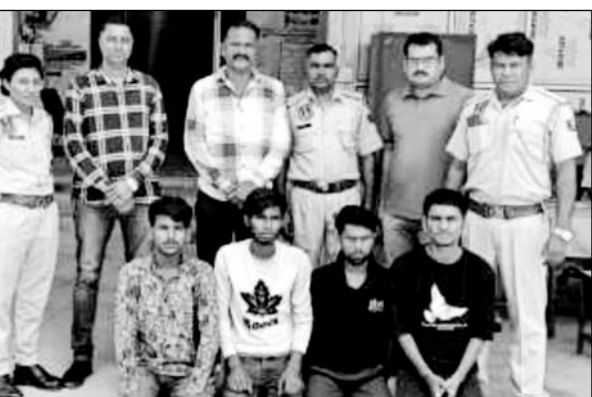
मुहाना थाना पुलिस ने नाबालिग के अपहरण की वारदात को अंजाम देने वाले युवकों को गिरफ्तार किया।

मुहाना थाना पुलिस ने साजिश रचने वाले नाबालिग को निरुद्ध कर, अपहरण की वारदात को अंजाम देने वाले 4 युवकों को गिरफ्तार किया