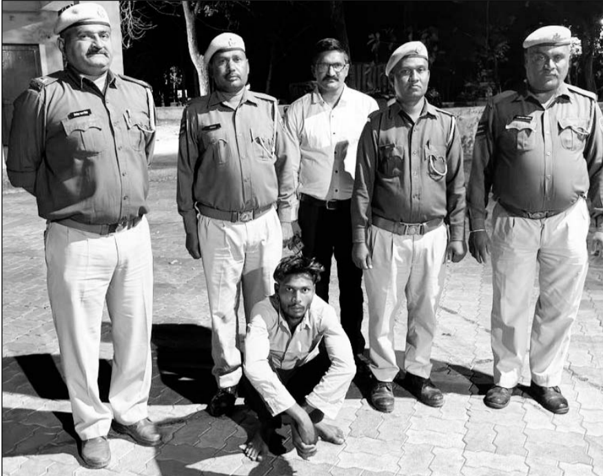
पुलिस ने ब्लाइंड मर्डर के आरोपी को गिरफ्तार किया।