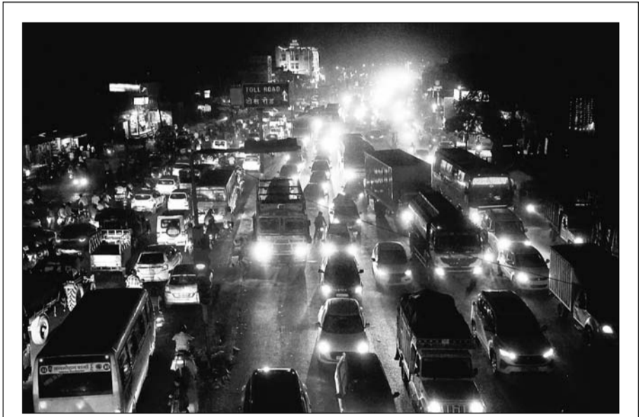
त्यौहारी सीजन में जाम लगना आम बात हो गई है। अभी दीपोत्सव के 6 दिन त्यौहार को मना कर लोग वापस अपने कार्यस्थल पर पहुंच रहे हैं जिससे सड़कों पर ट्रैफिक जाम की स्थिति बनी हुई है। सीकर रोड स्थित 14 नम्बर पुलिया के पास शहर की तरफ आने वाली सड़क पर शाम को वाहन लंबे जाम में फंस गये।

भर्ती परीक्षाओं का आयोजन सुनिश्चित भी कर रही है। मुख्यमंत्री ने स्थानीय निकाय विभाग को सफाईकर्मियों की भर्ती के लिए आवेदन प्रक्रिया शीघ्र निस्तारित करते हुए इसे पूर्ण पारदर्शिता के साथ संपादित करने के निर्देश भी दिए। उन्होंने कहा कि राज्य सरकार 48 हजार 593 चतुर्थ श्रेणी एवं समकक्ष पदों तथा 3 हजार 170 वाहन चालकों की भर्ती प्रक्रिया भी शीघ्र शुरू करेगी। उन्होंने विभिन्न विभागों को निर्देशित किया कि वे भर्तियों के संबंध में अर्द्धमासिक मार्च 2025 की स्थिति में भिजवाएँ, जिससे ज्यादा से ज्यादा पदों पर भर्तियां हो और युवाओं को अधिक से अधिक रोजगार के अवसर मिल सकें। इस कार्य में कोताही बरतने पर संबंधित विभाग के अधिकारी पर जिम्मेदारी तय की जाएगी। शर्मा ने परिवर्तित बजट 2024-25 की घोषणाओं की समीक्षा करते हुए कहा कि जिला स्तर पर लंबित विकास कार्यों के लिए कलकत्ता जनप्रतिनिधियों से चर्चा कर जमीन आवंटन सुनिश्चित करवाएँ। उन्होंने विभिन्न विभागों के उच्च अधिकारियों को महत्वपूर्ण परियोजनाओं एवं कार्यक्रमों की सतत मॉनिटरिंग करने के निर्देश भी प्रदान किए। बैठक में मुख्य सचिव सुधांशु पंत, अतिरिक्त मुख्य सचिव जल संसाधन अभय कुमार, अतिरिक्त मुख्य सचिव वित्त अखिल अरोड़ा, अतिरिक्त मुख्य सचिव ऊर्जा आलोक, अतिरिक्त मुख्य सचिव सामाजिक न्याय एवं अधिकारिता सुचिव प्रमोद कुमार, अतिरिक्त मुख्य सचिव ग्रामीण विकास श्रेया गुहा, प्रमुख सचिव मुख्यमंत्री कार्यालय आलोक गुप्ता सहित विभिन्न विभागों के प्रमुख शासन सचिव एवं सचिव उपस्थित रहे।