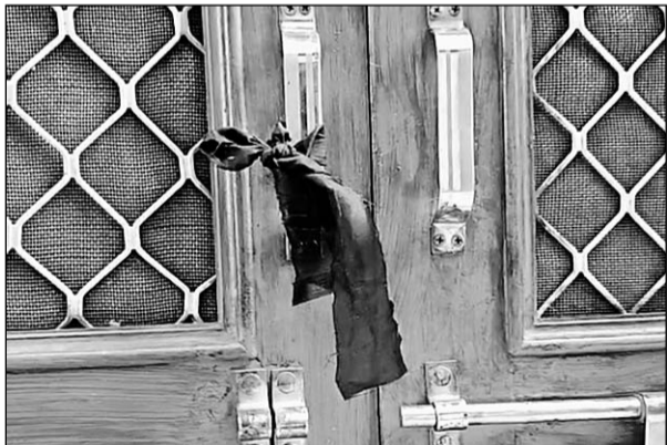
हिंदू समाज के लोगों ने घरों के बाहर विरोधस्वरूप काली पट्टियां बांधी

जानकारी के अनुसार उपनगर सांगानेर में दो दिन पहले गणेश पंडाल पर कुछ लोगों ने पथराव किया, जिससे माहौल गरमा गया था। बीती रात को भी सकल हिंदू समाज के लोगों ने कार्यवाही और कुछ मार्गों को लेकर पुलिस चौकी का घेरा किया, देर रात तक कोई समझौता नहीं हो पाया और सकल हिंदू समाज ने फैसला किया कि वह दूसरे पक्ष के त्योंहार को नहीं देखेंगे। इसी के चलते सोमवार सुबह काली मंगरी चले गए, जहां वह भजन कीर्तन कर रहे हैं और सामूहिक भोज का आयोजन किया