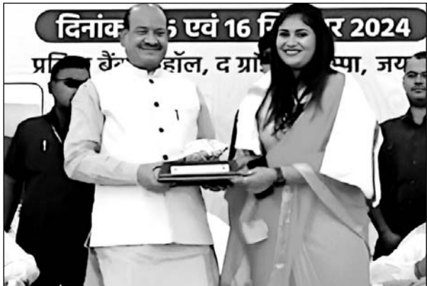
राजसमंद में आयोजित कार्यशाला में लोकसभा अध्यक्ष ओम बिरला, विधायक दीप्ति माहेश्वरी आदि मौजूद रहे।

राजसमंद, (निर्स)। विधायक दीप्ति माहेश्वरी ने राष्ट्रीय वैश्य महासम्मेलन द्वारा आयोजित विकसित भारत 2047-एक दृष्टि और वैश्य समाज विषयक कार्यशाला में भाग लेते हुए कहा कि वैश्य समाज ने हमेशा जातिगत संकीर्णता से ऊपर उठकर राष्ट्र निर्माण में महत्वपूर्ण भूमिका निभाई है। उन्होंने कार्यशाला की सराहना करते हुए कहा कि राष्ट्रीय वैश्य महासम्मेलन विकसित भारत की संकल्पना को साकार करने के लिए समाज में सजगता और एकता लाने का महत्वपूर्ण कार्य कर रहा है। कार्यशाला के मुख्य वक्ता लोकसभा अध्यक्ष ओम बिरला ने भी इस बात पर जोर दिया कि राजनीति और समाज में हमें जाति के आधार पर नहीं बल्कि हमारे कार्यों और समाज में योगदान के आधार पर अपना