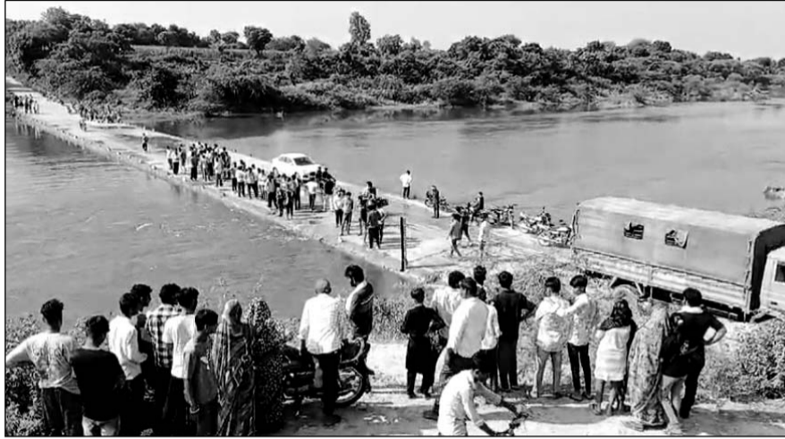
मांडलगढ़ में बीगोद के पास बनास नदी में बहे मां-बेटे के शव 21 घण्टे बाद मिले।