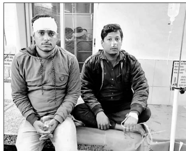
फायरिंग के घायलों का अस्पताल में उपचार किया।

भीलवाड़ा, (निर्स)। जिले के मांडल थाना क्षेत्र में विगत कुछ वर्षों से पुलिस के नजरअंदाज रवैये में बदमाशों के समूह पनपा दिए हैं। इन समूहों में बदमाशों के साथ इतने युवा लित चुके हैं जिनकी संख्या सैकड़ों से हजारों तक पहुंच चुकी है। बुधवार देर रात्रि हरिपुरा चौराहे पर तीन लगजरी कारों में सवार होकर आये करीब दो दर्जन से अधिक बदमाशों ने आते ही फिल्मी अंदाज में हवाई फायरिंग करते हुए वहां मौजूद व्यापारियों से मारपीट शुरू कर दी और मौके पर दुकानों और सब्जी के टेलों में जमकर तोड़फोड़ की। स्थानीय लोगों ने बताया कि यहां कई बदमाशों ने समूह बना रखे हैं जो आये दिन गुंडागर्दी कर अपनी मनमर्जी करते हैं और विरोध करने वालों के साथ मारपीट कर उनके व्यापार को नुकसान पहुंचाने की धमकियां देते हैं। बुधवार