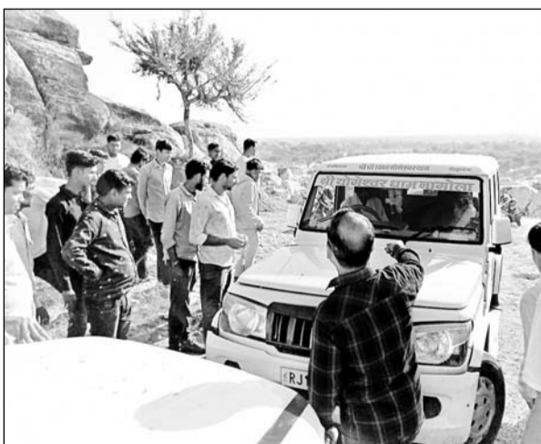
घटना स्थल पर लोगों की भीड़ जमा हो गई।