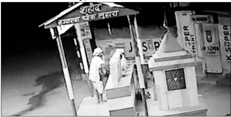
सुजानगढ़ गांव लुहारा के सार्वजनिक चौक से मिले सीसीटीवी फुटेज।

सुजानगढ़, (निर्स)। क्षेत्र के गांव लुहारा के सार्वजनिक चौक में निर्मित शहीद स्मारक में लगी शहीद