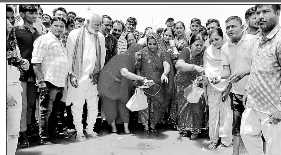
बालोतरा में लूणी नदी के आने से ग्रामीणों ने पूजा-अर्चना की।

सिवाणा उपखण्ड क्षेत्र के मोतीसरा गांव में घुसा पानी :-