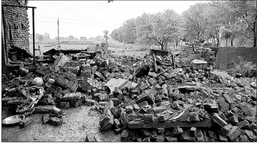
धौलपुर जिले में भारी बारिश से मनियां में एक मकान के दो कमरे भरभरा कर गिर गए।

दो महिलाओं सहित चार लोग गंभीर रूप से घायल