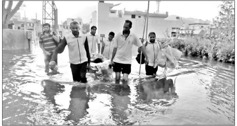
अजमेर में 'बिपरजाय' तूफान के दौरान जिला प्रशासन और नागरिक सुरक्षा दल ने लोगों को खतरे वाले क्षेत्रों से बाहर निकाला।

अजमेर में लगातार बारिश से कई सालों का रिकॉर्ड टूटा