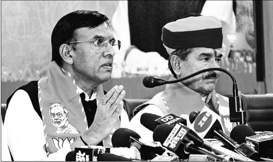
केंद्रीय श्रम एवं रोजगार, युवा कार्यक्रम एवं खेल मंत्री डॉ. मनसुख मांडविया ने भाजपा प्रदेश कार्यालय में प्रेसवार्ता को संबोधित किया। इस दौरान प्रदेशाध्यक्ष मदन राठौड़ भी मौजूद थे।

जयपुर। केंद्रीय श्रम एवं रोजगार, युवा कार्यक्रम एवं खेल मंत्री मनसुख मांडविया ने भाजपा प्रदेश कार्यालय में प्रेसवार्ता को संबोधित करते हुए कहा कि 2014 में मोदी के नेतृत्व में एक नई कार्यशैली विकसित हुई है। सरकार द्वारा बनाए जा रहे बजट में दूरदर्शी सोच रखते हुए सर्वस्पर्शी, सर्व समावेशी और समग्र विकास को शामिल किया गया। प्रधानमंत्री नरेंद्र मोदी ने पिछले दस सालों में देश को एक नई दिशा देने का कार्य किया है। आजादी के 75 वर्ष पूर्ण होने पर प्रधानमंत्री नरेंद्र मोदी ने अमृत महोत्सव काल के दौरान 2047 तक विकसित भारत का सपना देश के सामने रखा और उस सपने को साकार करने की दिशा में रोजमैप भी तैयार कर देश की 140 करोड़ जनता के सामने रखा। केंद्र सरकार की ओर से तैयार किए जा रहे बजट में विकसित भारत के सपने को गति प्रदान करने की कार्यशैली देखने को मिल रही है।