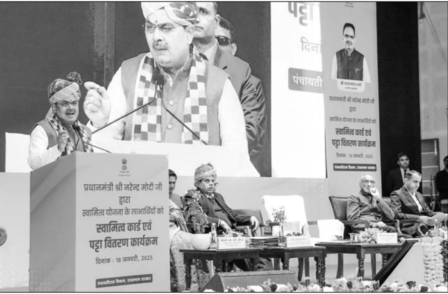
प्रधानमंत्री नरेन्द्र मोदी ने शनिवार को नई दिल्ली से वीडियो कॉन्फ्रेंसिंग के जरिये स्वामित्व कार्ड व पट्टा वितरण कार्यक्रम में मुख्यमंत्री भजनलाल से संबोधित किया।