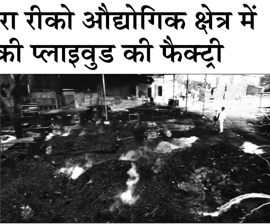
जयपुर ग्रामीण जिले के कालाडेरा रीको औद्योगिक क्षेत्र में सोमवार अल सुबह अचानक प्लाइवुड फैक्ट्री में आग लग गई, जिससे फैक्ट्री में रखी हजारों रुपए की प्लाइवुड व लकड़ी का कचरा राख हो गया।

जयपुर। जयपुर ग्रामीण जिले के कालाडेरा रीको औद्योगिक क्षेत्र में सोमवार अल सुबह अचानक प्लाइवुड फैक्ट्री में आग लग गई, जिससे फैक्ट्री में रखी हजारों रुपए की प्लाइवुड व लकड़ी का कचरा राख हो गया। बाद में आग लगने की सूचना पर मिलने पर चौमू, कालाडेरा व मण्डा रीको औद्योगिक क्षेत्र से पहुंची चार दमकलों की मदद से आग पर काबू पाया गया।