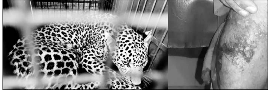
वन विभाग की टीम ने मौके पर पहुंचकर पैंथर को पींजरे में कैद किया।

हिम्मत से बची जान, लोगों के सहयोग से पैंथर को रस्सों से बांधा