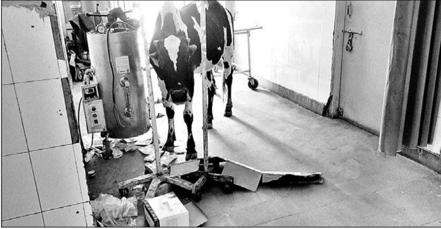
मालपुरा के सरकारी अस्पताल में लैबर रूम व आँटी के सामने खड़े आवादा जानवर।