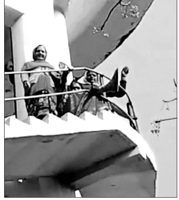
पानी की किल्लत से परेशान महिलाएं टंकी पर चढ़ गईं।

स्कीम 10बी को अमृत योजना में कनेक्शन देने की बात कही थी। लेकिन अब अमृत योजना में कनेक्शन नहीं दिया गया। वार्ड में तीन बोरिंग बताते हैं। लेकिन पानी कहा जाता है। कोई जानकारी नहीं दे रहे हैं। वार्ड के लोगों