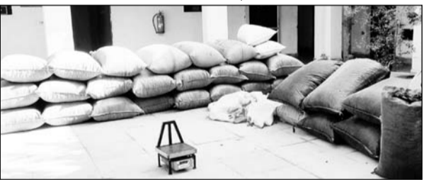
कानोड़ पुलिस की कार्यवाही में जब्त किया गया डोडा-चूरा।

उदयपुर/कानोड़, (निसं)। कानोड़ थाना पुलिस द्वारा की गई कार्यवाही के फलस्वरूप डोडा-चूरा लंदे वाहनों लॉक करते हुए सुने बाड़े छोड़कर अंधेरा का लाभ लेते हुए भाग निकले थे। इसके बाद पुलिस ने कार के लॉक खोलने के लिए पत्थर से कांच तोड़कर वाहनों को पुलिस थाने ले जाया गया। जानकारी के अनुसार टीम ने बिना नम्बर की पिकअप व स्कॉपीयों गाड़ी में भरे हुए 63 क्विंटों में डोडा-चूरा लंदे था। दोनों ही वाहनों को पुलिस ट्रैक्टर के पीछे बांधकर थाने लाई