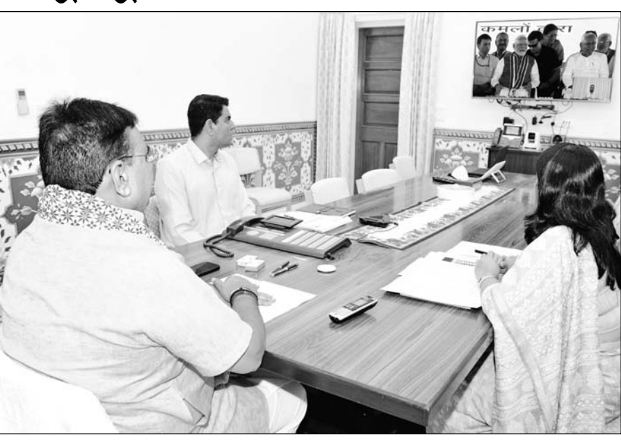
प्रधानमंत्री नरेन्द्र मोदी ने बुधवार को बिहार के दरभंगा से देश को 12 हजार करोड़ रुपए की सड़क, रेलवे, स्वास्थ्य सहित विभिन्न सेक्टर की 25 से अधिक परियोजनाओं की सौगात दी। मुख्यमंत्री भजनलाल शर्मा मुख्यमंत्री निवास से इस कार्यक्रम में वीडियो कॉन्फ्रेंस के माध्यम से जुड़े।

जयपुरा प्रधानमंत्री नरेन्द्र मोदी ने बुधवार को बिहार के दरभंगा से देश को 12 हजार करोड़ रुपए की सड़क, रेलवे, स्वास्थ्य सहित विभिन्न सेक्टर की 25 से अधिक परियोजनाओं की सौगात दी। कार्यक्रम में राजस्थान में भी जयपुर, बाड़मेर एवं फालना में प्रधानमंत्री