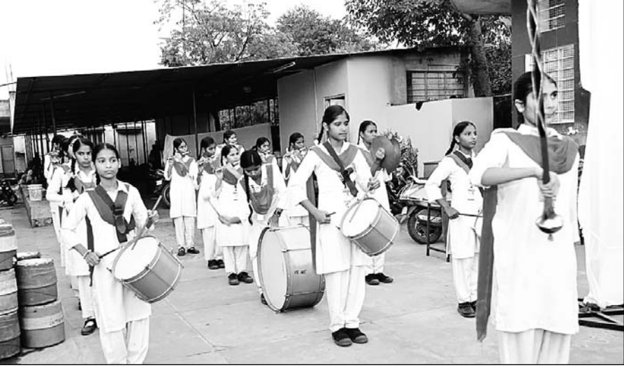
अखिल भारतीय विद्या भारती शिक्षा संस्थान के तत्वावधान में बुधवार को जयपुर में जवाहर नगर के सरस्वती बालिका विद्या मन्दिर में विज्ञान मेले का शुभारम्भ हुआ। इस अवसर पर बालिकाओं ने रंगारंग प्रस्तुति दी।