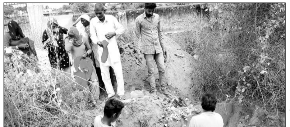
ग्राम नासरपुर में संक्रमित गाय को दफनाते मजदूर परिवार।

■ प्रशासन को सूचना के बाद भी कोई नहीं पहुंचा