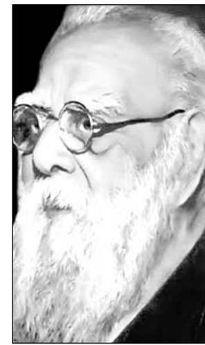
ई.वी. रामास्वामी पेरियार

■ ब्राह्मणों के निःशुल्क भोजन पंडाल से धक्का मारकर निकालने पर वे रूढ़िवादी हिन्दुत्व के घोर विरोधी हो गए