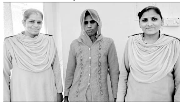
सास की हत्या करने करने वाली बहू पुलिस गिरफ्तार में।