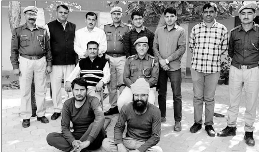
अवैध शराब परिवहन करने के आरोप में दो जनों को गिरफ्तार किया।