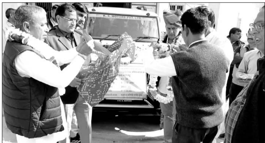
सहायक अभियंताओं के लिए निरीक्षण के लिए विधायक रामलाल ने गाड़ी रवाना की।

चौमू/कालाडेर (निर्सं) पंचायत समिति गोविन्दगढ़ में सहायक अभियंताओं के लिए निरीक्षण के लिए विधायक कोष से 11.88 लाख में नई बोलेरो गाड़ी क्रय की गई है। जिसका शुभारंभ आज पंचायत समिति गोविन्दगढ़ में पूर्व विधायक रामलाल