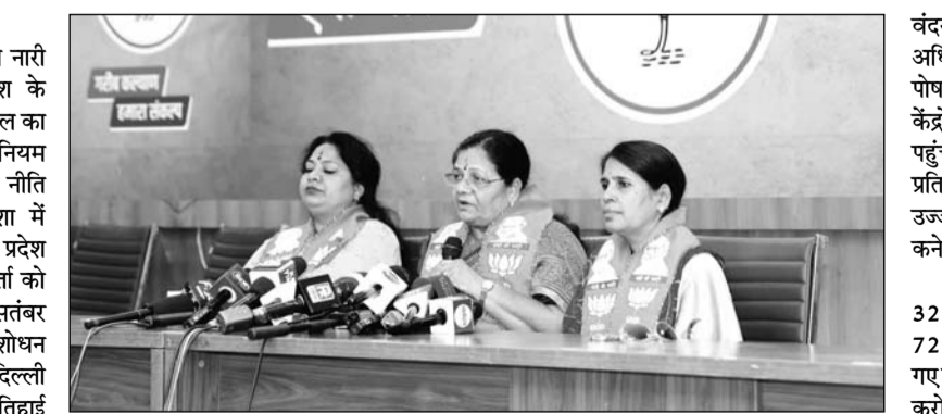
जयपुर शहर सांसद मंजू शर्मा ने रविवार को भाजपा प्रदेश कार्यालय में प्रेसवार्ता की।

जयपुर। जयपुर शहर सांसद मंजू शर्मा ने नारी शक्ति वंदन अधिनियम-2023 को देश के लोकतांत्रिक इतिहास में एक ऐतिहासिक मील का पत्थर बताया है। उन्होंने कहा कि यह अधिनियम महिलाओं को सशक्त बनाने के साथ उन्हें नीति निर्माण की मुख्यधारा में लाने की दिशा में महत्वपूर्ण भूमिका निभाएगा। भाजपा प्रदेश कार्यालय में रविवार को आयोजित प्रेसवार्ता को संबोधित करते हुए सांसद शर्मा ने कहा कि सितंबर 2023 में पारित यह संवैधानिक संशोधन लोकसभा, राज्य विधानसभाओं और दिल्ली विधानसभा में महिलाओं के लिए एक-तिहाई आरक्षण सुनिश्चित करता है। यह कदम महिलाओं के सशक्तिकरण के साथ-साथ देश के समग्र विकास को नई गति देगा।