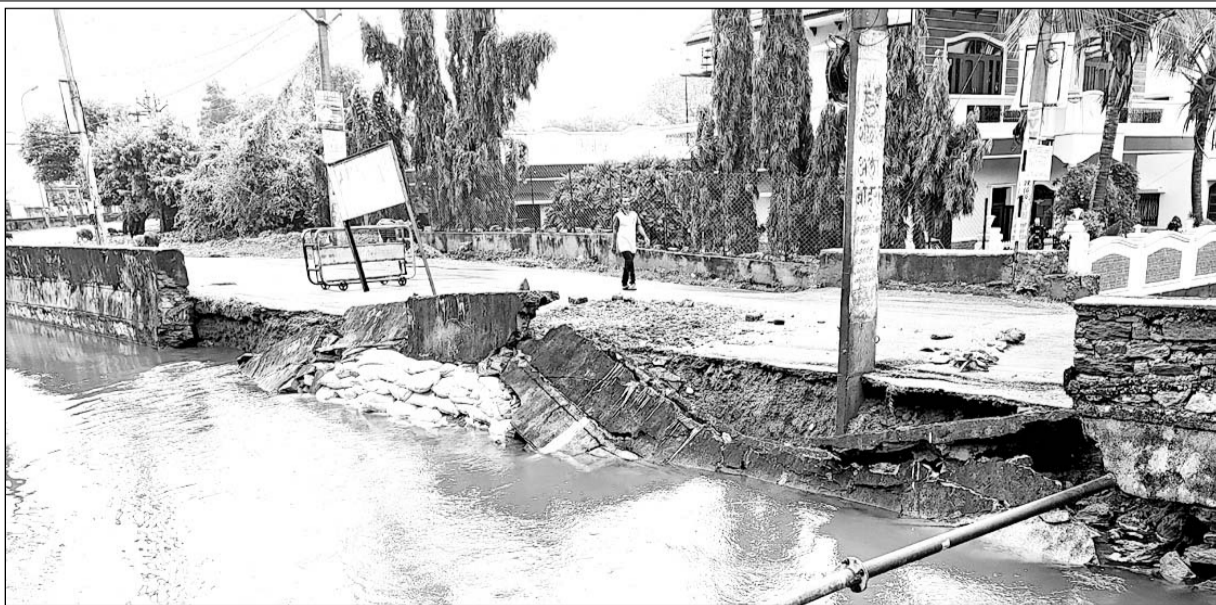
उदयपुर की मदार नहर के बुधवार को ढहे हिस्से की पूरी दीवार गुरुवार को भी धंस गई।

उदयपुर, (कासं)। शहर के नीमचखेड़ा पुलिया के समीप बुधवार को क्षतिग्रस्त हुई मदार नहर के दीवार का कुछ हिस्सा धंसने के बाद गुरुवार को हिस्से के आगे की दीवार भी ढहकर पानी में गिर गई। इधर पानी की आवक बढ़ने पर अब नहर का