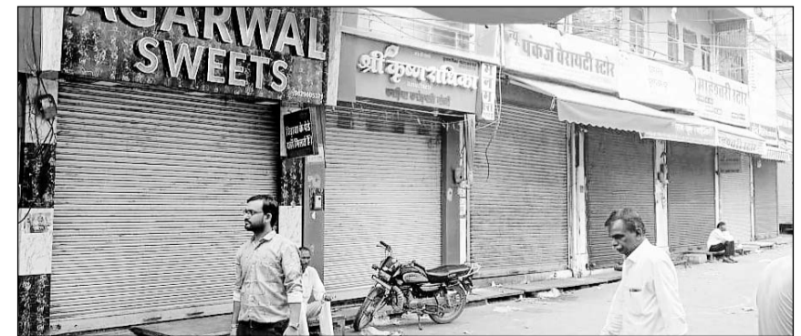
घटना के विरोध में बंद पड़े खाटूश्यामजी के बाजार।